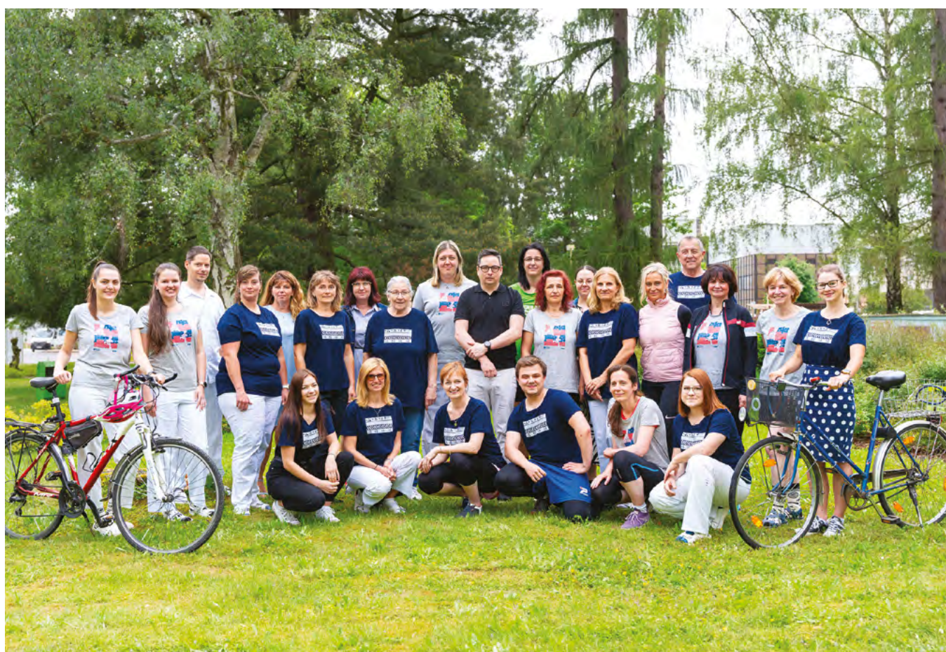
Účastníci letošní výzvy Do práce na kole

Současný životní styl, zejména západní civilizace, se stále víc vzdaluje od přirozeného pravidelného pohybu. Udržovat se v kondici není v dnešní uspěchané době zrovna jednoduché. Máme spoustu povinností, které nám zabírají větší část dne. Můžeme se cítit unaveně, a ztrácet tak potřebnou motivaci. V takových chvílích je však podle odborníků právě dodržování zdravých návyků o to důležitější. Obzvláště pravidelný pohyb totiž napomáhá nejen ke zlepšení fyzické kondice, ale také duševní pohody.