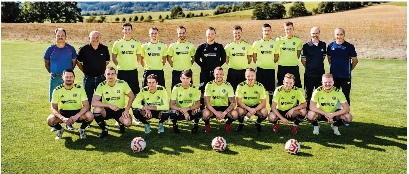
Fotbalový tým TJ Jiskra Rapotín

Přestože jsem právník a stále se věnuji advokacii, uvědomuji si, že práce starosty mi přináší konkrétnější a viditelnější výsledky než advokacie. V advokacii nenacházím takové hmatatelné výsledky jako při „starostování“. Z této pozice vidím konkrétní výsledky, což mi dodává novou motivaci k další práci. Mám možnost přispívat k lepšímu životu našich občanů prostřednictvím přípravy a realizace nových investic, stejně jako organizací spolkových aktivit pro všechny věkové skupiny obyvatel. V Rapotíně pracuje 24 spolků, je radost jejich aktivity podporovat. Stinnou stránkou mé práce je především to, že starosta nezná pracovní dobu. V českých podmínkách je běžné, že se stává „veřejným majetkem“ a musí být všude, a také nese za vše odpovědnost. Dokonce i za to, co přímo nemůže ovlivnit. Časová náročnost zasahuje velmi silně do osobního života. Pokud nechcete dělat starostu „údržbáře“, ale chcete pracovat svědomitě a naplno, pak na soukromé aktivity téměř vůbec není čas. Ale je to volba každého z nás a já tuto práci vykonávám s plným vědomím toho, jakou cenu za ni platím.