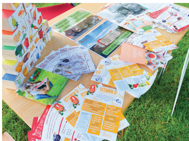
Stanoviště Nemocnice Šumperk na Dni Země

V pátek 19. dubna se v parku za vilou Doris uskutečnil každoroční Den Země. Letošním tématem bylo motto Plasty vs. planeta a pro malé i velké návštěvníky byla přichystána spousta zajímavých aktivit. Jednou z nich bylo i stanoviště naší nutriční terapeutky, která si pro účastníky připravila mimo jiné poradenství o výživě, měření hmotnosti, vědomostní hry a další. K tématu jsme si připravili obrázkovou prezentaci toho, jaké odpady u nás v nemocnici třídíme. Akce byla bohužel z důvodu nepříznivého počasí ukončena předčasně, ale o to více se těšíme na příští ročník!