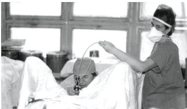
Endoresekcce prostaty před 40 lety