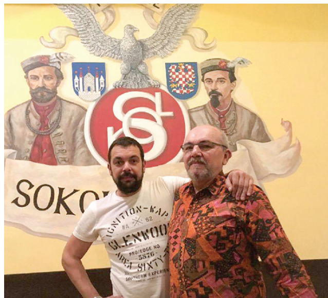
Poslední Fügneri na Moravě